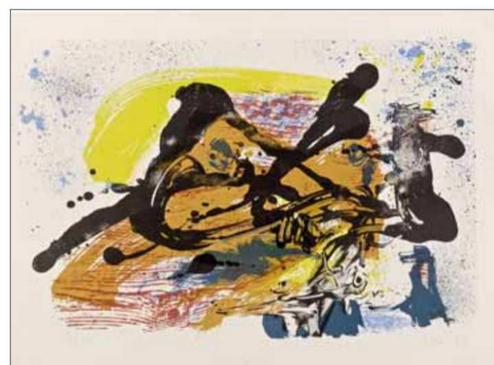
PARA VER EN SANTIAGO. — “Nostalgie sans espoir”, litografía, 1958, 41 x 63 cm, que está en el Museo Jorn, será una de las obras que vendrá al país.