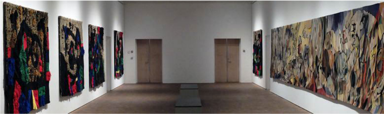
Miró & Jorn: Installationsfoto med gobelinerne "Firbenet med de gyldne fjer" og "Den lange rejse".

værk, vil man muligvis se en distinktion i mentalitet. Ikke desto mindre giver en eksemplarisk kuratering af den aktuelle udstilling et eminent flow i helheden.